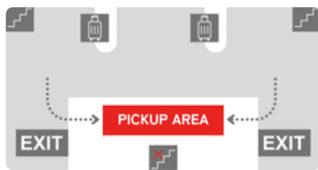
マクタン・セブ国際空港 Terminal 1 国内線