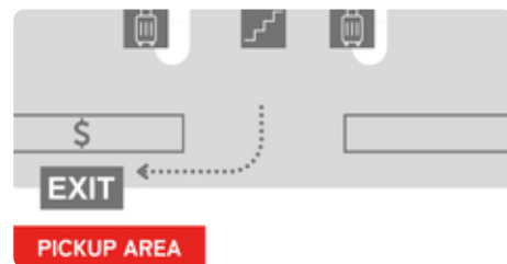
マクタン・セブ国際空港 Terminal 2 国際線